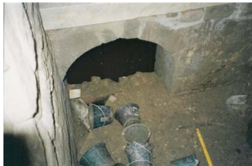
Le dégagement de la cave