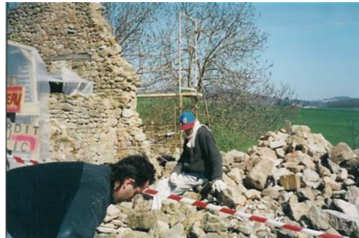
La sauvegarde du pignon